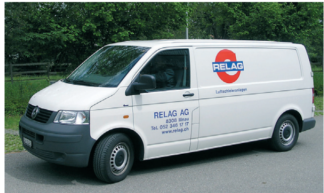
Alle Servicefahrzeuge sind speziell für die Wartung ausgerüstet

Gerne beraten wir Sie persönlich und objektbezogen. Profitieren Sie von unserer langjährigen Erfahrung!